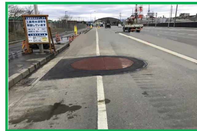
コース上に鉄板があります