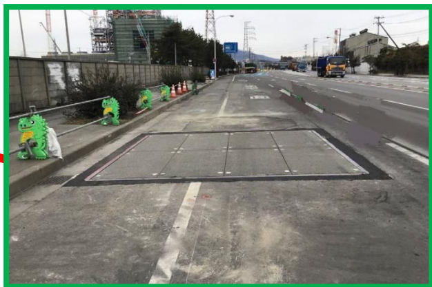
コース上に鉄板があります